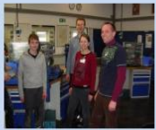
... bei Fa. Weiss Umwelttechnik

www.tks-gruenberg.de/uploads/dateien/beruf/Bericht%20Praktikumstag%20Homepage.pdf