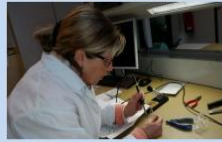
... bei Fa. Bender