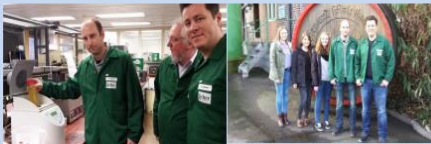
... in der Licher Privatbrauerei